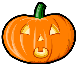
Halloween í október. Skera út!